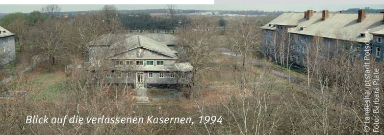
Blick auf die verlassenen Kasernen, 1994

18. Jahrhundert ausschließlich das Militär den Ton angegeben hatte. Denn bis zum endgültigen Abzug der russischen Truppen 1994 war das Gebiet als ältester Truppenübungsplatz der Stadt fest in militärischer Hand. Den entscheidenden Impuls zur Entwicklung und Erschließung des Areals nördlich der Pappelallee brachte die Bundesgartenschau (BUGA) 2001. Unter der Maßgabe des Erhalts und der Nachnutzung der ortsprägenden historischen Kasernenanlagen wurden ganze Straßenzüge mit Einfamilienhäusern und modernen Mehrfamilienhäusern gebaut. Neues Leben ist eingezogen. Neben Dienstleistungsunternehmen und Gewerbe hat auch die Fachhochschule Potsdam hier ihren zentralen Campus errichtet.