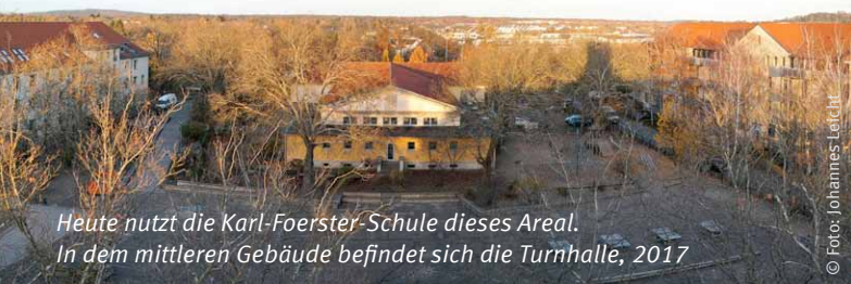
Heute nutzt die Karl-Foerster-Schule dieses Areal. In dem mittleren Gebäude befindet sich die Turnhalle, 2017